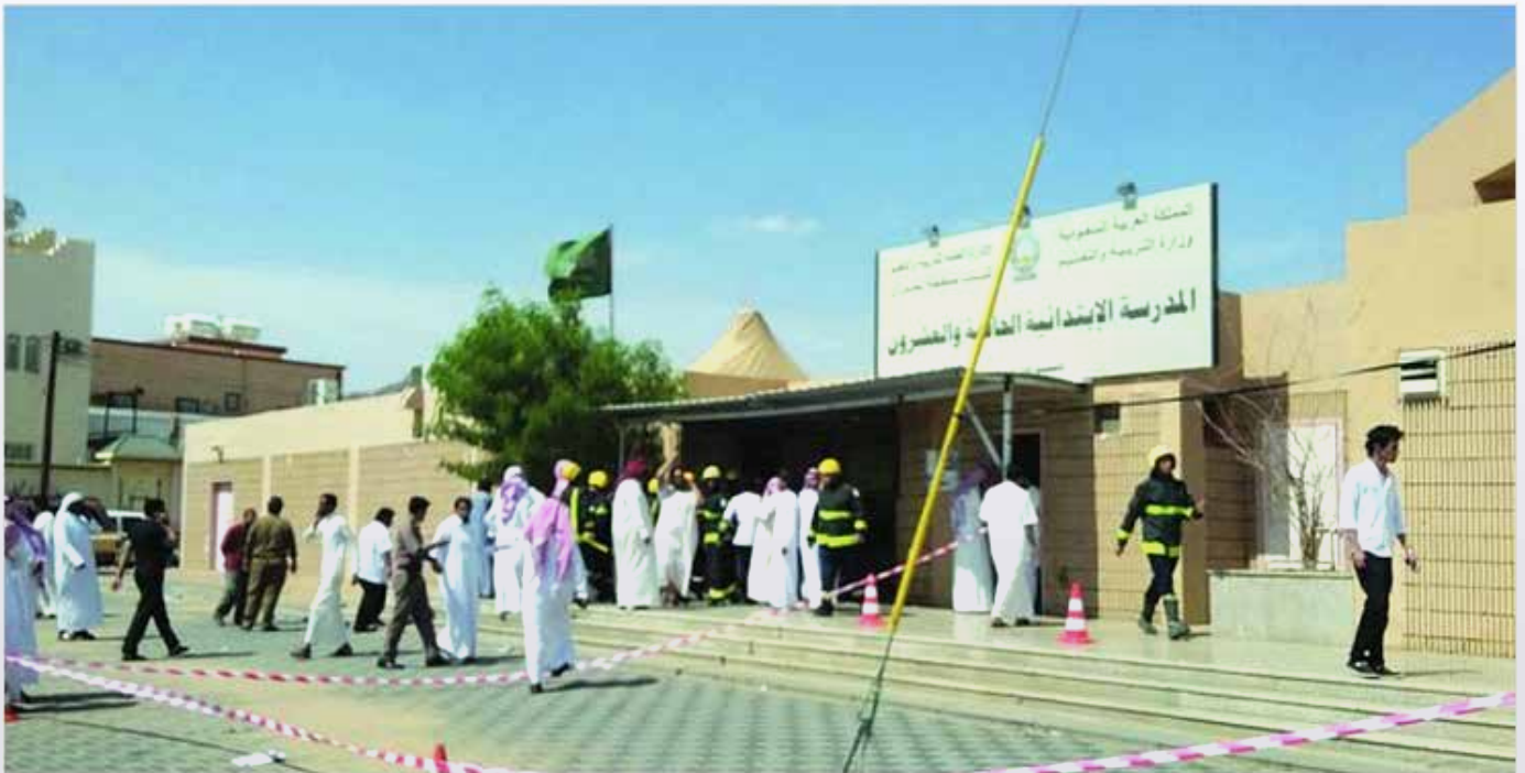
الدفاع المدني يباشر الحادث