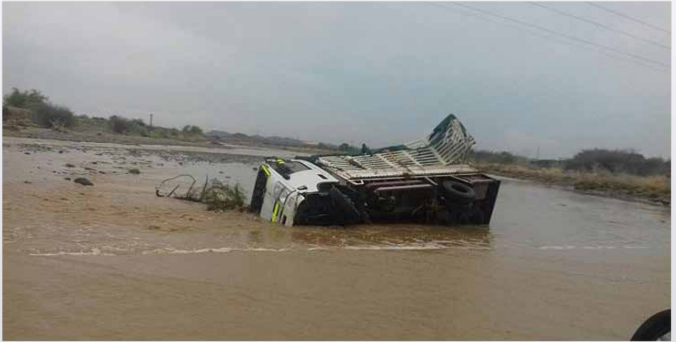
الشاحنة سقطت في مجرى السيل بوادي قنونا