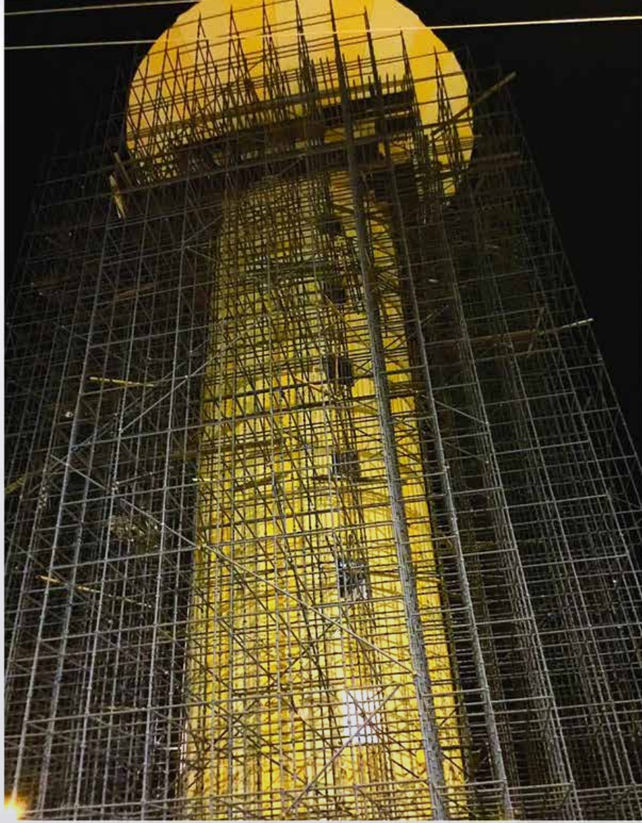
برج المياه الذي احتجز فيه الشاب تحت الإنشاء