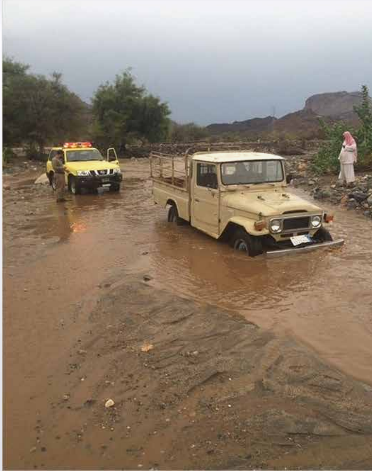
المجازفة بدخول الأودية تعرض حياة قائد المركبة ومرافقيه للخطر