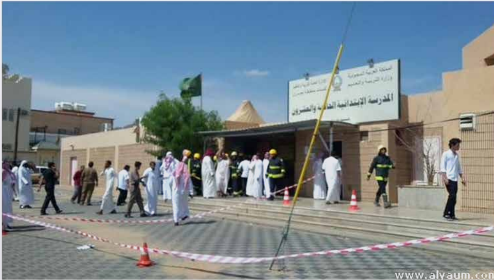
واس - نجران