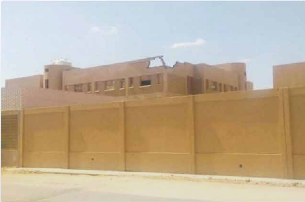
المدرسة التي تعرضت لسقوط المقذوف أمس