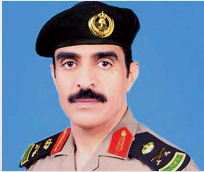
اللواء صالح الحارثي