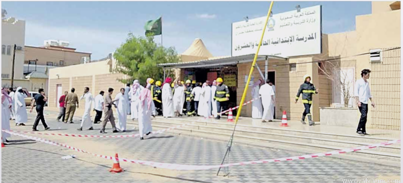
رجال الدفاع المدني خلال إخلاء إحدى المدارس أمس