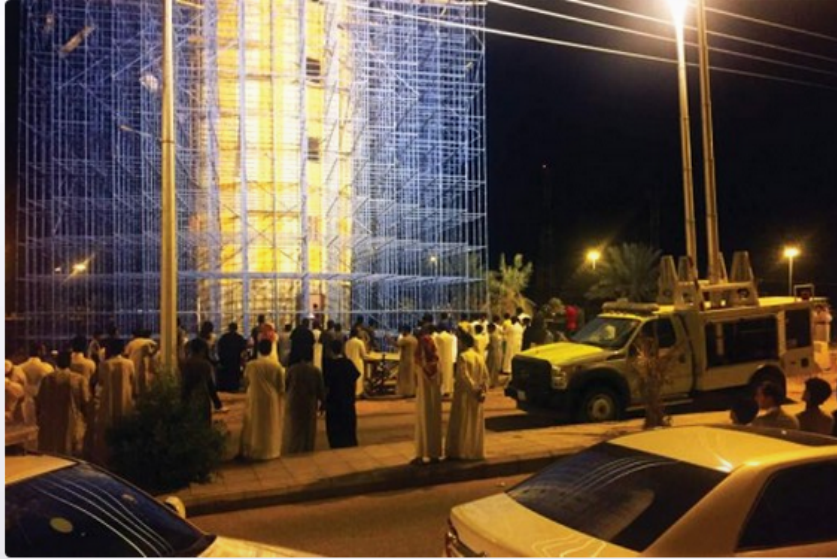
الجهات الأمنية أمام خزان المياه (الشرق)