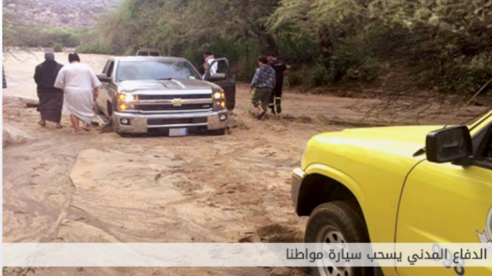
الدفاع المدني يسحب سيارة مواطنا