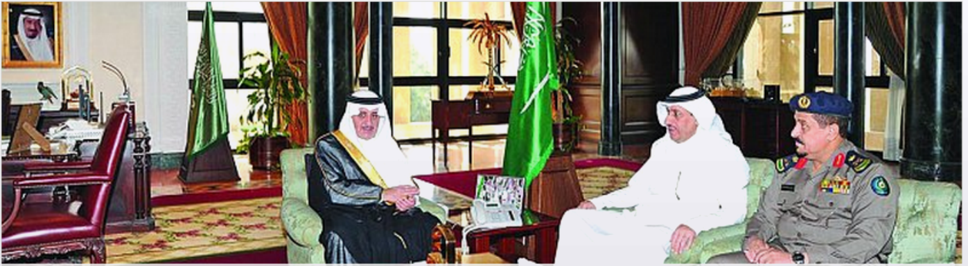
الأمير فهد بن سلطان مستقبلاً مدير الدفاع المدني بمنطقة تبوك، بحضور وكيل الإمارة